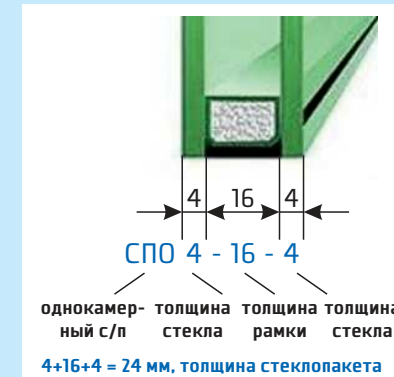
Рисунок №2 (Конструкция однокамерного стеклопакета)

- двухкамерный стеклопакет из трех стекол толщиной 4 мм марки М1, с дистанционными рамками 12 и 14 мм, заполненного аргоном, толщиной 38 мм: СПД 4М1-12 Ar-4М1-14 Ar-4М1 38 мм.