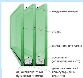
Рисунок №1 (Конструкция двухкамерного стеклопакета)

Sibglass Pro предлагает стеклопакеты (далее - с/п) двух типов: однокамерные (СПО) – два стекла, соединенных по контуру дистанционной рамкой, двухкамерные (СПД) – три стекла, соединенные дистанционными рамками.