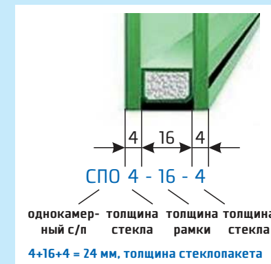
Рисунок №2 (Конструкция однокамерного стеклопакета)

- двухкамерный стеклопакет из трех стекол толщиной 4 мм марки М1, с дистанционными рамками 12 и 14 мм, заполненного аргоном, толщиной 38 мм: СПД 4М1-12 Ar -4М1-14 Ar -4М1 38 мм.