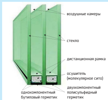
Рисунок №1 (Конструкция двухкамерного стеклопакета)

Sibglass Pro предлагает стеклопакеты (далее - с/п) двух типов: однокамерные (СПО) – два стекла, соединенных по контуру дистанционной рамкой, двухкамерные (СПД) – три стекла, соединенные дистанционными рамками.